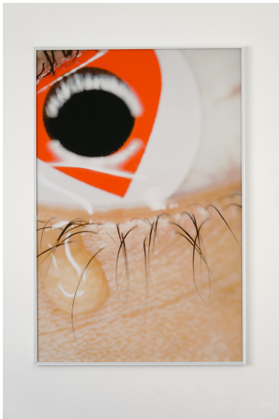
James Gregory Atkinson Hypersensitive (blowing things out of proportion), 2016 Injektprint auf Dibond, gerahmt 165 x 110 cm

© James Gregory Atkinson Foto: Thomas Schröder