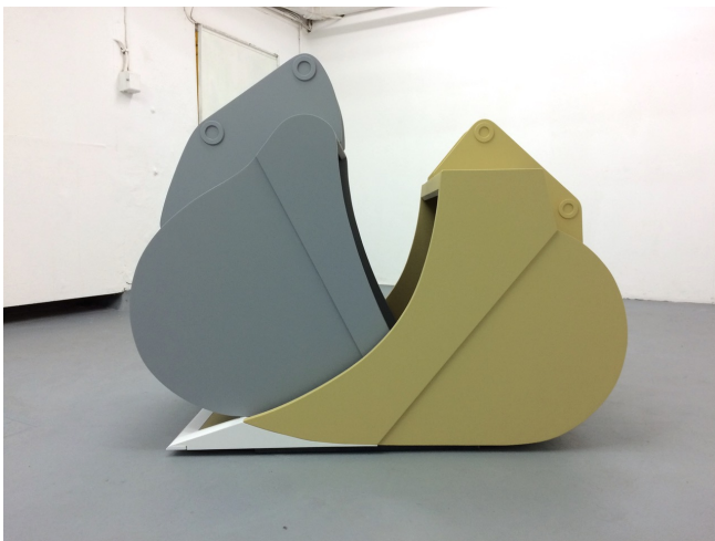
Martin Wenzel L'amour, très dur , 2016 MDF, Biegesperrholz, pigmentierter Vorlack