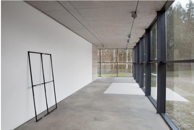
Hannah Rath Division / Frame , 2015/16 Gebeiztes Holz, Lack, Pappe, EfaIn 185 x 120 cm Ausstellungsansicht „Hen to Pan“ in der Galerie in der Wassermühle Trittau