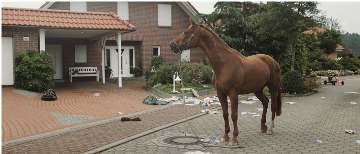
Julia Charlotte Richter You are the Center of the world , 2015 Video-Installation (projection) / screening-version, 4k, cinemascope (16:42 min)

© Julia Charlotte Richter/ Galerie Anita Beckers/ VG Bild-Kunst, Bonn 2016