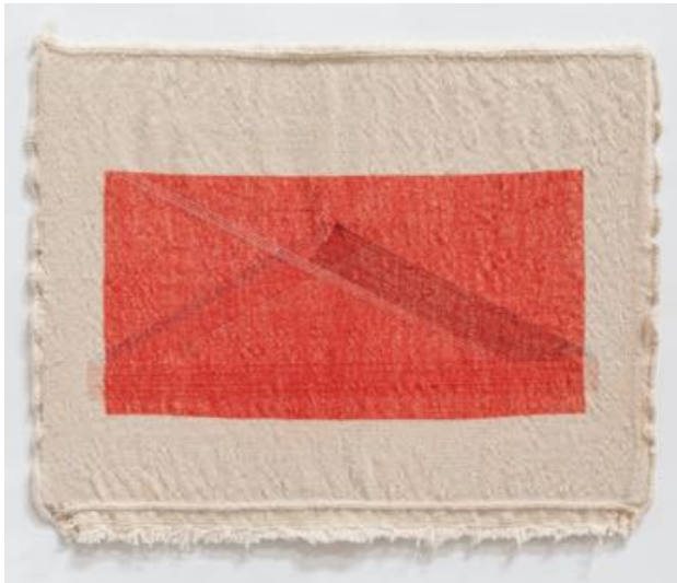
Haleh Redjaian Mountain, 2020

Fäden und Lithografie auf handgewebtem Textil 50 x 60 cm