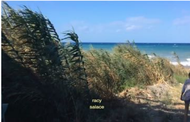
Rosa Aiello Amore Molesto , 2017 (Videostill) HD Video, 27.28 Minuten