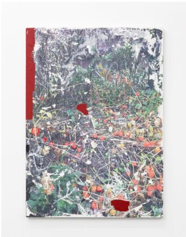
Laura Langer What Decomposes Is Nature , 2017 Fotografischer Transfer Acryl und Marker auf Leinwand, 110 x 80 cm Installationsansicht Weiss Falk, Basel