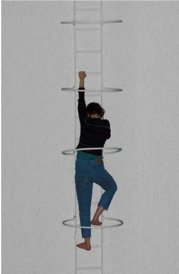
Daniel Stubenvoll The Great Escape (Direction Direction) , 2019 Digitaldruck auf Seide 240 x 168 cm