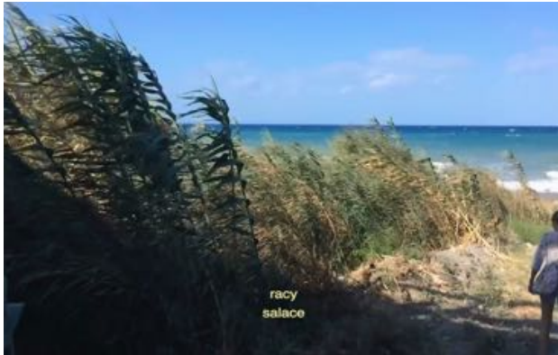
Rosa Aiello Amore Molesto , 2017 (Videostill) HD Video, 27.28 Minuten