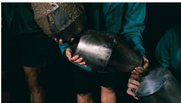
Onur Gökmen All the rivers run into the sea, yet the sea is never full , 2017 Videostill, 3.36 min