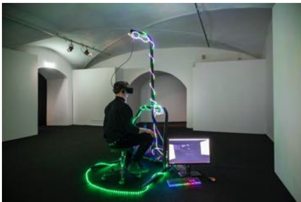
Patrick Alan Banfield My View , 2019 Installationsansicht Palazzo Strozzi, Florenz