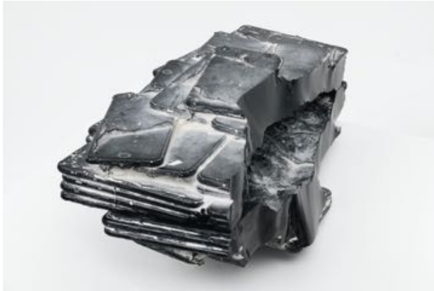
Antonia Hirsch Cleft , 2020 schwarzer Glasguss 20 x 44 x 25 cm

© Antonia Hirsch und VG Bild- Kunst