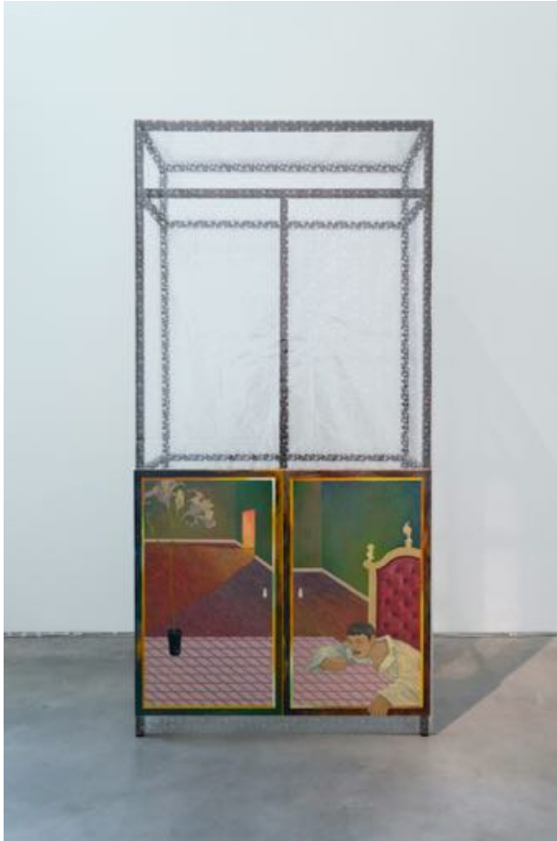
Yong Xiang Li Loaded Lines, Plastic Rain