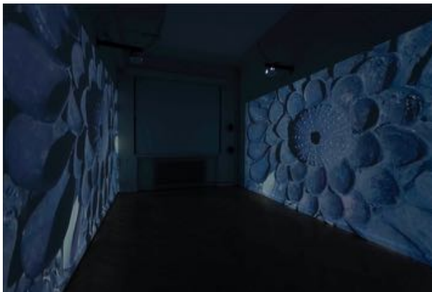
Nina Kuttler 1000 Mouths , 2019 HD Video, 7.30 min Installationsansicht

© Antonia Hirsch und VG Bild- Kunst Foto: Trevor Good