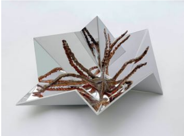
Yvonne Roeb STELLA MARIS , 2019 Ton, Pigmente, Lack, Spiegel, Holz, Tape 68 × 113 × 150 cm