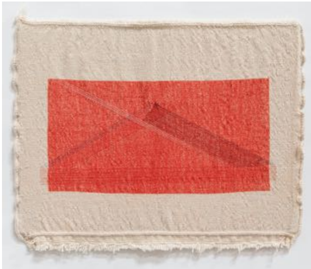
Haleh Redjaian Mountain, 2020

Fäden und Lithografie auf handgewebtem Textil 50 x 60 cm