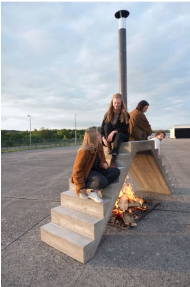
Max Brück Bauboom , 2020 Mixed Media Installation